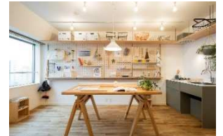
「T×HAPTIC with HANDS」イメージ

東急住宅リースは今後も、オーナー様の資産運用サポートを可能にするサービスのご提供に取り組んでまいります。