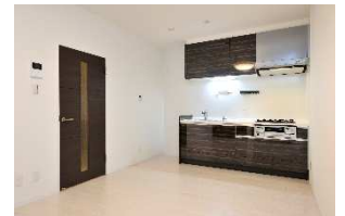
「リモデルアップ」施工後イメージ

「T×HAPTIC with HANDS」は、当社とナチュラル系リフォームで実績のある工事会社ハプティック株式会社、株式会社東急ハンズが提携して開発した商品です。木のぬくもりやあたたかさを感じていただけるように無垢の床材を使用し、壁面を収納場所として活用できる有孔ボードを設置しています。